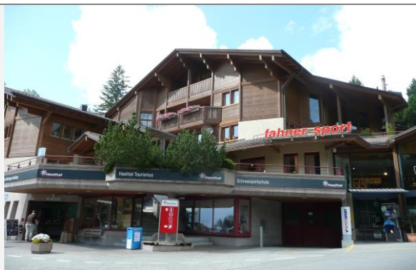
Wohn-u. Geschäftshaus Twing