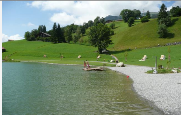
Badesee, 5 min. von WHG